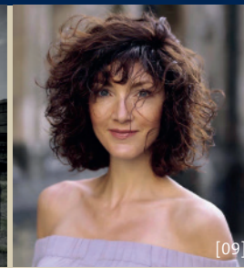
[08] MAFFAY-SHOW-BAND [09] NEA!