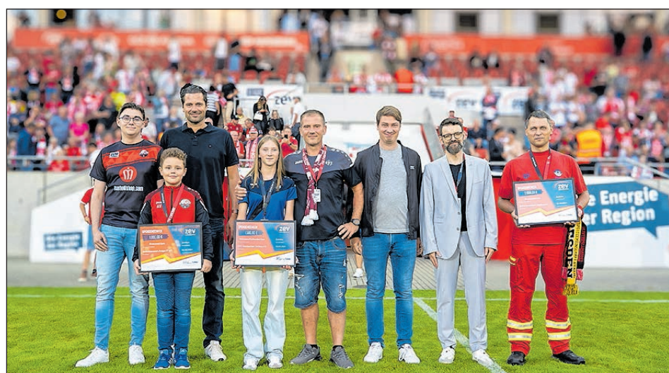
DIE ÜBERGABE DER SPENDENSHECKS DER AKTION „SPORTLERHERZ“ ERFOLGTE IM RAHMEN DES PUNKTSPIELS ZWISCHEN DEM FSV ZWICKAU UND DEM GREIFSWALDER FC AM VERGANGENEN FREITAG IN DER GGZ ARENA.