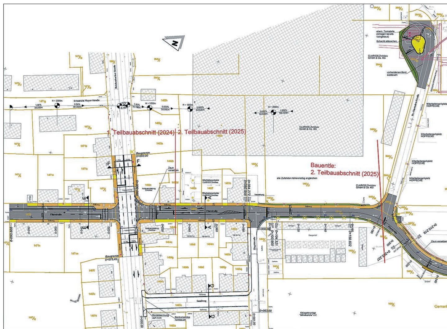
LAGEPLAN DER FLURSTRASSE MIT DEN BEIDEN TEILBAUABSCHNITTEN.

Die Stadt Zwickau bittet bereits jetzt insbesondere die Anlieger und ortsansässigen Unternehmen um Verständnis für die letztlich unvermeidbaren Beeinträchtigungen und Behinderungen.