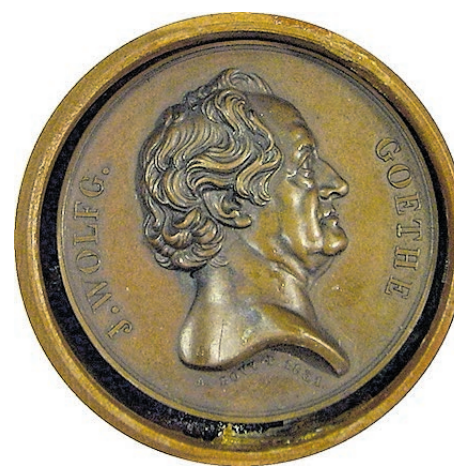
RELIEFMEDAILLE, DIE DER DICHTER GOETHE DER JUNGEN CLARA WIECK SCHENKTE.

Die Sonderausstellung im Robert-Schumann-Haus dokumentiert diese vielfältigen Beziehungen. Dabei können aus den reichhaltigen Handschriftenbeständen der Zwickauer Sammlung nicht nur zahlreiche Autographen Robert und Clara