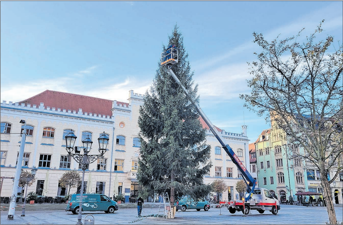
EIN WEIHNACHTSBAUM AUS DEM VOGTLAND ZIERT SEIT MONTAG DEN ZWICKAUER HAUPTMARKT UND LÄUTET DAMIT DIE VORWEIHNACHTSZEIT EIN. DIE 20 METER HOHE UND ETWA 30 JAHRE ALTE FICHTE WURDE WIE GEWOHNT VON DER WALDWIRTSCHAFT JACOB PLATZIERT. DIE FIRMA ELEKTROANLAGEN M&W GMBH AUS ZWICKAU INSTALLIERTE GESTERN DIE BELEUCHTUNG.