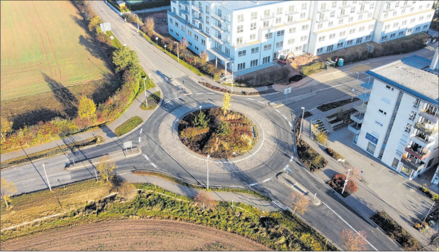
DER KREISVERKEHR AUF DER STEINPLEISER STRASSE HAT EINE NEUE DECKSCHICHT ERHALTEN.

Auch wenn die Schlussrechnungen der Baubetriebe noch nicht vorliegen, kann bereits zum jetzigen Zeitpunkt eingeschätzt werden, dass die Gesamtkosten beider Baumaßnahmen im geplanten Kostenrahmen liegen. Für den Kreisverkehr Steinpleißer Straße standen 200.000 Euro, für die Reinsdorfer Straße 100.000 Euro zur Verfügung.